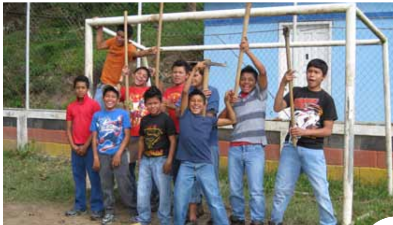
Rafael-Jungs in ihren neuen Arbeitskleidern.

«Unsere Kinder werden wöchentlich mehrere Stunden in diversen Arbeiten geschult. Dazu haben sie nun Arbeitskleidung erhalten.» Unsere Missionarinnen haben die Hosen angepasst und umgenäht. Ermöglicht wurde die Anschaffung der Jeans, T-Shirts und der guten Schuhe durch die Kollekte der evangelischen Kirchgemeinde Erlen und durch eine Privatspende. Herzlichen Dank für dieses grossartige Geschenk! So macht das Arbeiten gleich mehr Spass.