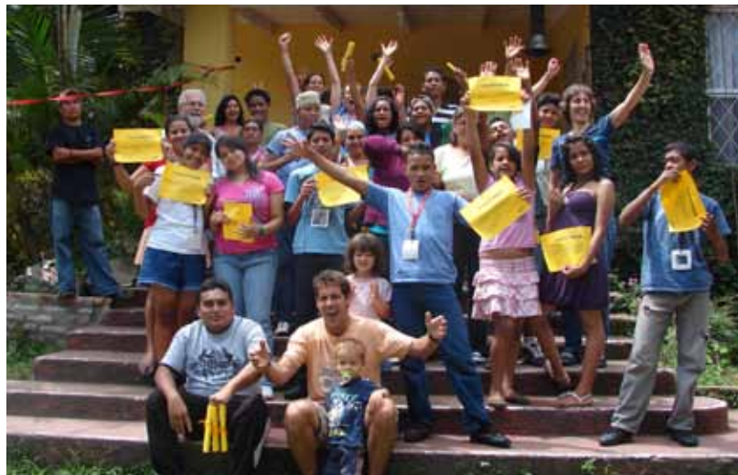
Bild: Gruppenfoto der Lagerwoche im Casa Girasol mit Strassenkindern.

Ohne auch nur zu ahnen, was mich erwarten würde, machte ich mich auf den langen Weg von Magdeburg, Deutschland nach Tegucigalpa, Honduras. Neben den beschwerlichen Seiten einer solchen 36-stündigen Reise versuchte ich mich auf die guten Ereignisse zu konzentrieren. Dazu gehörte der Kontakt zu einer Frau mittlerer Reife auf dem New Yorker Flughafen. Auf ihrem Laptop klebte ein Deutschland-Aufkleber, der mich veranlasste, sie auf Deutsch anzusprechen. Sie wohnt in Atlanta und ist Amerikanerin. Derzeit unterrichtet sie in einer Highschool Deutsch und Französisch. Es war eine tiefgehende Unterhaltung, und voller Dankbarkeit nahm ich das Angebot, zum Hotel gefahren zu werden, an. Kurz darauf konnte ich in einem