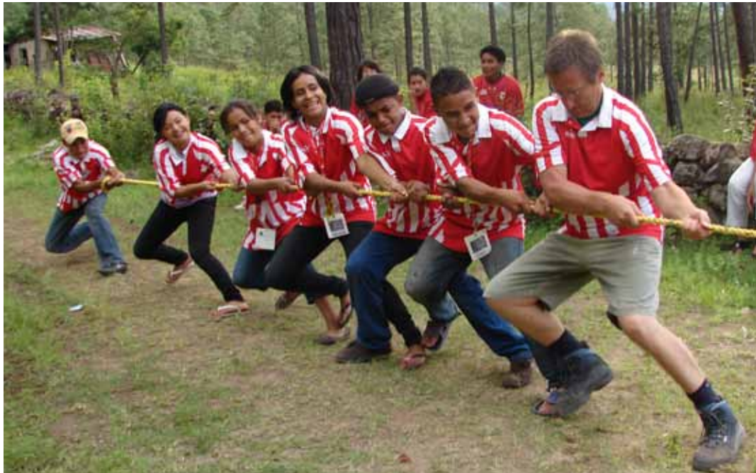
Bild: Seilziehen während einer Lagerwoche im Casa Girasol.